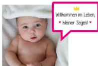
Segensfeier für Babys und Kleinkinder